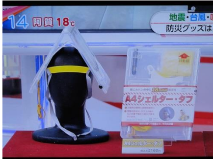
2014年10月16日 TBS「あさチャン！」