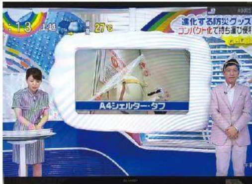
◆ 2015年7月9日 日本テレビ「ZIP」